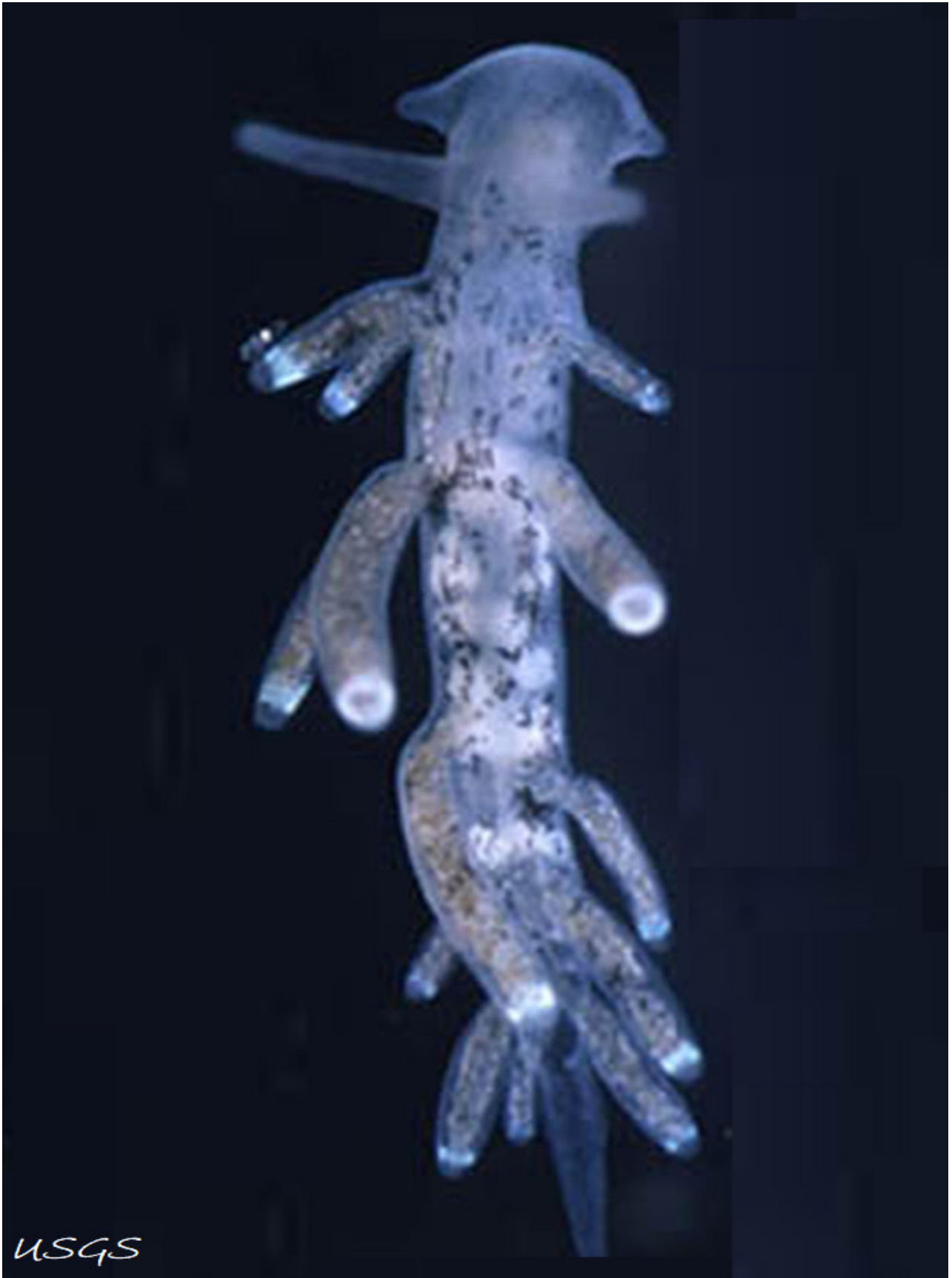
By USGS - Tenellia adpersa Public Domain, https://commons.wikimedia.org/w/index.php?curid=5190026 Tenellia adpersa (Nordmann, 1845) – Trincheseiidae